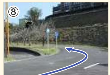
⑧ ラスト250m。緩やかな上り基調。 無理な追い越しは危険!