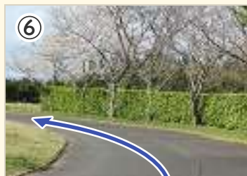
⑥ 野球場の周囲は緩やかなカーブ が続くので無理な追い越し禁止。