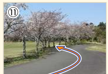
⑪ ゴール後はここから左にゆっくりと 芝生エリアに入ろう。