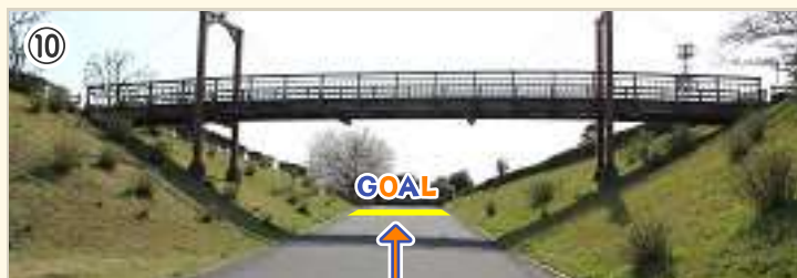
⑩ ゴール! 直後に左カーブがあるので、走行ラインをキープしよう。 橋の上はスプリントが見られる絶好の観戦ポイント。