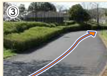
③ ここから下り区間。 コース取りに気をつけよう。