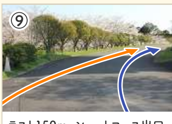
⑨ ラスト150m。ショートコース出口。 アウトラインは逆バンクに注意! ゴールスプリントはまっすぐ走ろう。