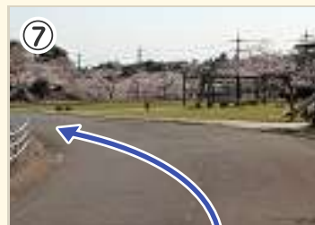
⑦ トイレ横。ここからの無理な追い 上げは危険。冷静に走ろう。