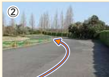
② 道幅広く、見通しが良い。 前方に出ていくチャンス!