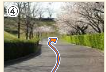
④ この先、右コーナーからの上り。 コース取りに気をつけよう。