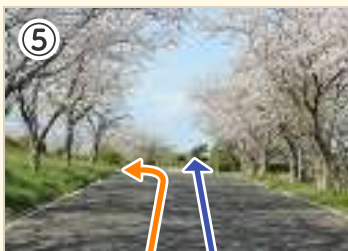
⑤ 野球場入口。 ショートコースはここを左折。